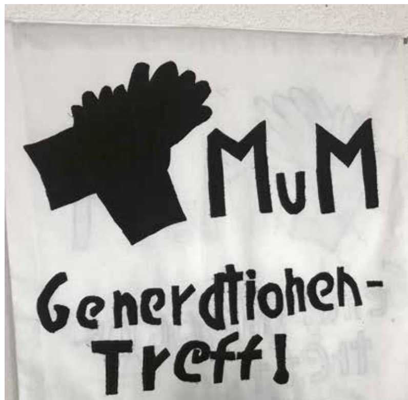
● Generationentreff Raboldshausen

Der demographische Wandel zeigt insbesondere Auswirkungen in den verschiedenen Bereichen der öffentlichen Daseinsvorsorge. Vor dem Hintergrund einer Sicherstellung gleichwertiger Lebensverhältnisse in den ländlichen Räumen sind die Entwicklungen der sozialen Infrastruktur und Daseinsvorsorge eine wesentliche Aufgabe von Politik und öffent-