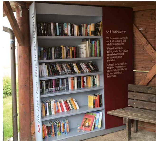
● Bücherschrank Neutsch

Dezentrale Angebote zur Förderung des lebenslangen Lernens können die Attraktivität als Wohn- und Lebensstandort erhöhen. Sie können ggf. durch bestehende Institutionen oder bürgerschaftliches Engagement ausgebaut werden.