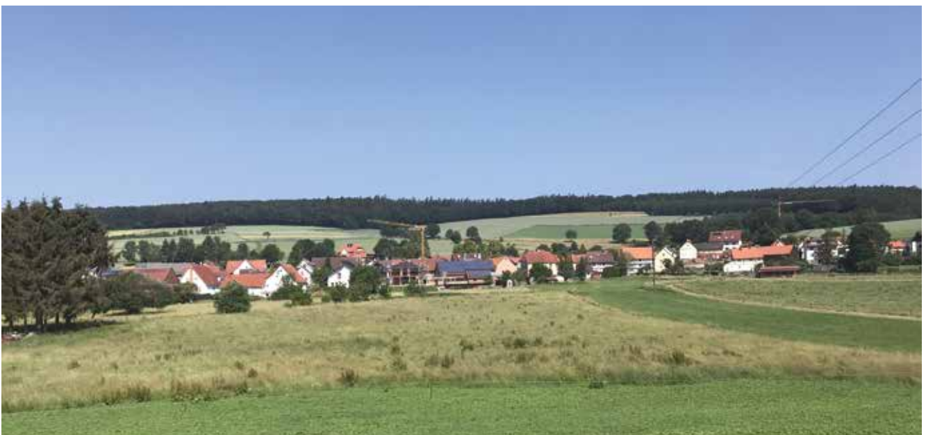
● Neubaugebiet Kathus

Erklärte Zielsetzung der Dorfentwicklung ist die Lenkung der Investitionen in die Ortskerne. Daher sind grundsätzlich nur Investitionen in den Ortskernen förderfähig. Die Richtlinie sieht für private Vorhaben eine Förderung nur in den abgegrenzten Fördergebieten in den Ortskernen und bei Kulturdenkmälern