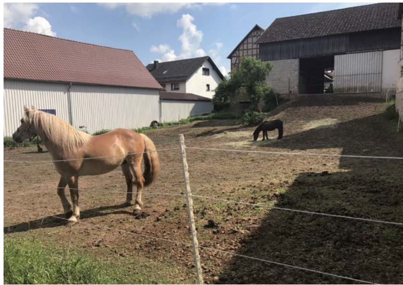
● Pferdeweide Frohnhausen

Um einer dauerhaften Beeinträchtigung von Ortsbild, Wohnumfeldqualität und Immobilienmarkt entgegenzuwirken, sind nachhaltige Strategien zum Umgang mit Leerstand von Wohngebäuden, Nebengebäuden, Gewerbeimmobilien usw. gefragt. Für die entsprechenden Anpassungserfordernisse müssen Handlungsoptionen für die Ortskerne formuliert werden. Es sind konkrete Aussagen zu den vorhandenen Siedlungsbereichen einschließlich Grünordnung, Gebäuden und Infrastrukturen zu erarbeiten.