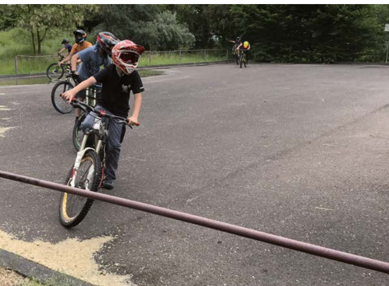
● Funpark Niederwalgern

Zur Erreichung dieses Programmziels ist eine Auseinandersetzung mit der städtebaulichen Entwicklung ein festes Modul und zentrales Handlungsfeld im IKEK. Grundlage der städtebaulichen Entwicklung ist die Erfassung des bau- und kulturgeschichtlichen Erbes sowie der Innenentwicklungspotentiale (Leerstände, Baulücken usw.) der Ortskerne. Darüber hinaus ist eine Überprüfung der aktuellen Planungen sowie der Zielrichtung der Siedlungsentwicklung erforderlich.