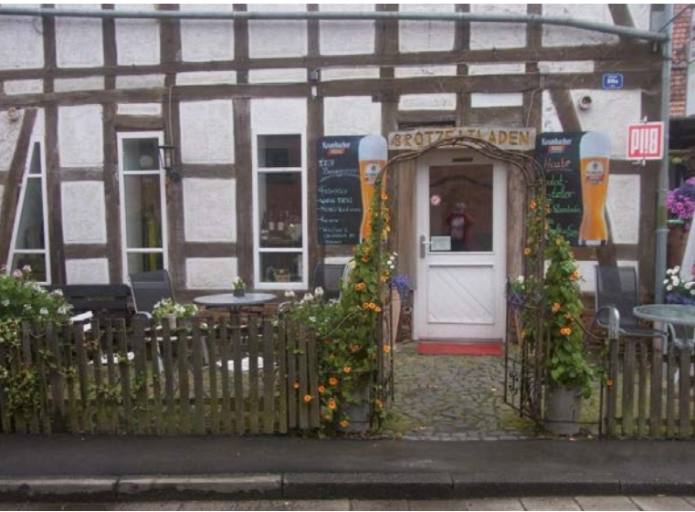
● Brotzeitladen Kirchhain

quantitativ gutes Angebot sicherstellen. Auch Kindergärten sind von den Auswirkungen des demografischen Wandels betroffen. Die zukünftige Auslastung der Standorte, ggf. Standortschließungen, die Erreichbarkeit der (verbleibenden) Standorte und auch andere Formen der Kinderbetreuung können wichtige Fragestellungen für eine gesamt-kommunale Diskussion sein. Im Bereich neuer Wohnformen besteht - gerade zur Förderung der Innenentwicklung - grundsätzlicher Bedarf bei der Entwicklung und Umsetzung von Projekten. Hierbei kann es sowohl um selbst bestimmtes Wohnen in flexiblen Formen für ältere Menschen als auch um Angebote für jüngere Menschen und Familien gehen.