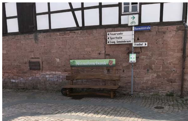
● Mitnahmebank Wald-Amorbach

Die sinnvolle Verknüpfung dieser beiden Bereiche ist allerdings eine organisatorische Herausforderung. Angesichts einer zunehmenden Zahl nicht selbstständig mobiler Bewohnerinnen und Bewohner müssen auf kommunaler bzw. regionaler Ebene mittelfristig nachhaltige Mobilitätskonzepte mit innovativen Lösungen (adäquat, flexibel und kombinierbar) entwickelt werden. Damit sollen die Voraussetzungen für funktionierende Mobilitätsketten